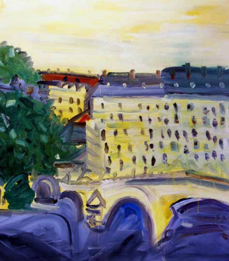
A partir de: Paris, Sena