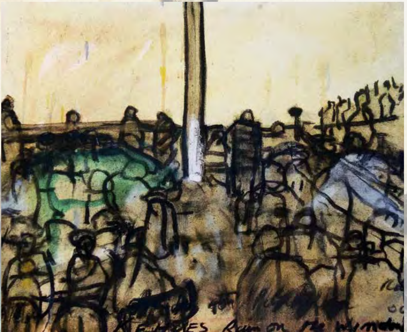
A partir de: Kehoes, rain on the window