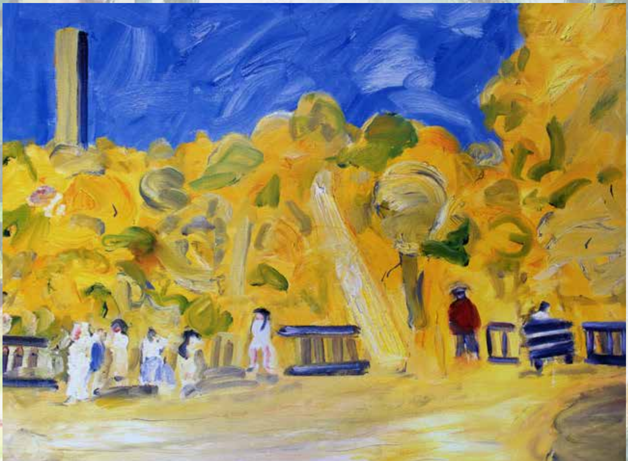
A partir de: Les Jardins de Luxemburg