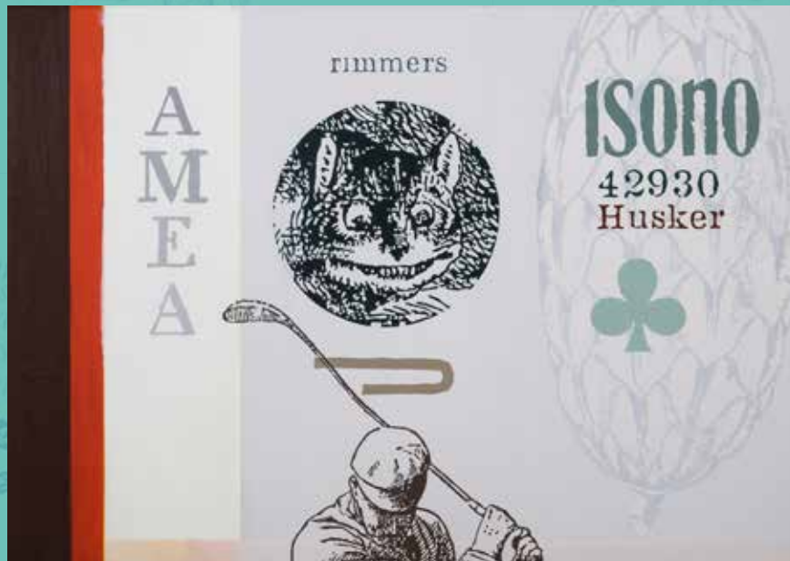
De ramas y de hojas. Óleo sobre lienzo. 65 x 92 cm.