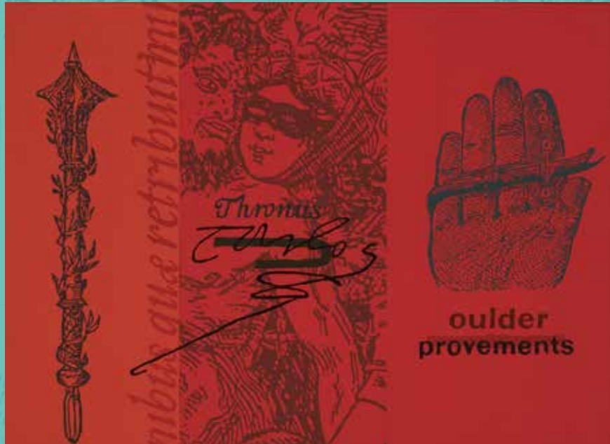
Bajaba por la calle Dancourt. Óleo sobre lienzo. 60 x 73 cm.