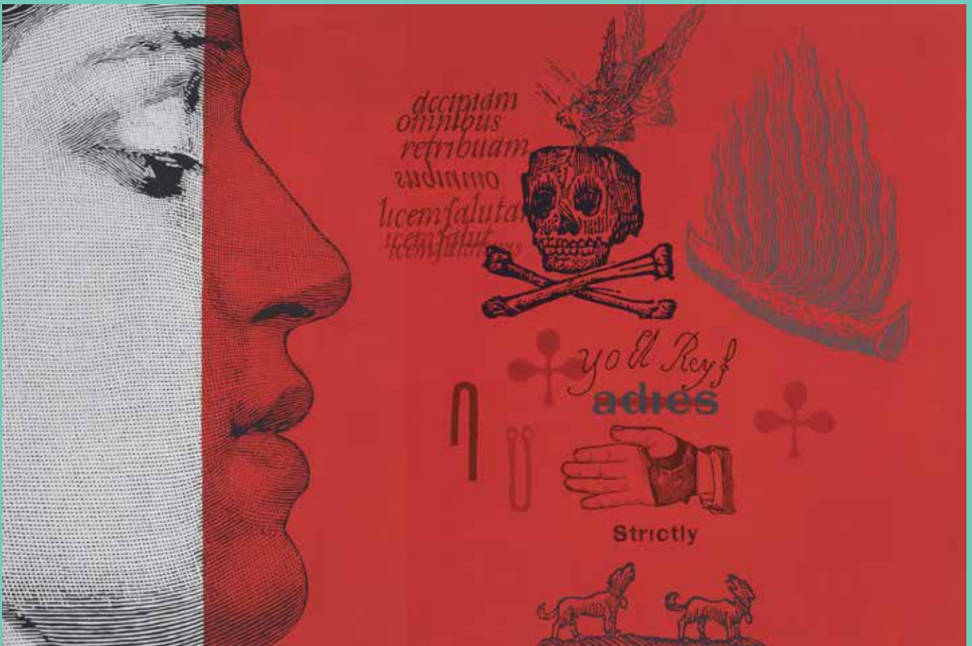
El sonido de tu huella. Óleo sobre lienzo. 130 x 195 cm.

Carlos Vidal (Chiapa de Corzo 1957). Doctorando en Pintura por la Universidad Complutense de Madrid, estudió en la Escuela de Pintura y Escultura “La Esmeralda” del INBA y en la Escuela Nacional de Artes Plásticas “San Carlos” de la UNAM. Miembro del Sistema Nacional de Creadores FONCA/CONACULTA.