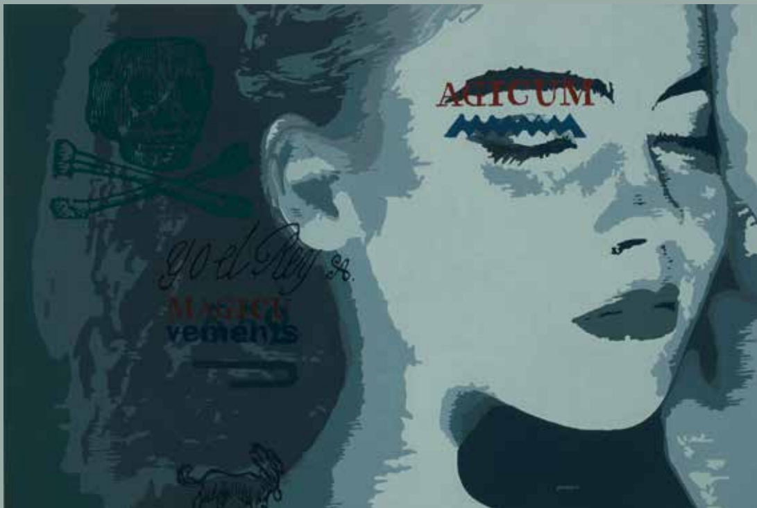
Todo es inventado de nuevo. Óleo sobre lienzo. 81 x 116 cm.